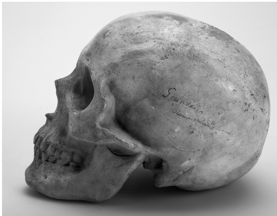
Рис. 2. Гипсовый слепок черепа грузинки из собрания И.Ф. Blumenбаха. Приобретение К.М. Бэра для Анатомического кабинета Академии наук. МАЭ 5075-3

ла время своего становления, нужно было создать ей хорошие условия и прочную богатую базу для исследований – Кунсткамеру, которая, безусловно, являлась научной принадлежностью Академии.