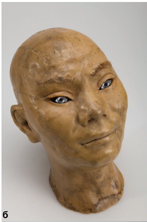
Рис. 4. Восковые головы манекенов: а – китайца (МАЭ № 1027-1), б – остяка (МАЭ № 1027-2), в – мужчины европеоидного типа (МАЭ № 1027-3)