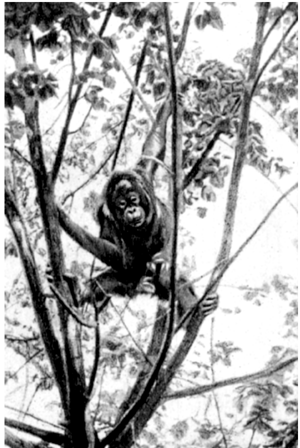
Рисунок 2. «... молодой орангутан на прогулке» [Большая Советская Энциклопедия, 1933, Зоопарки II] Figure 2. "...a young orangutan on a walk" [BSE, 1933, Zoos II]