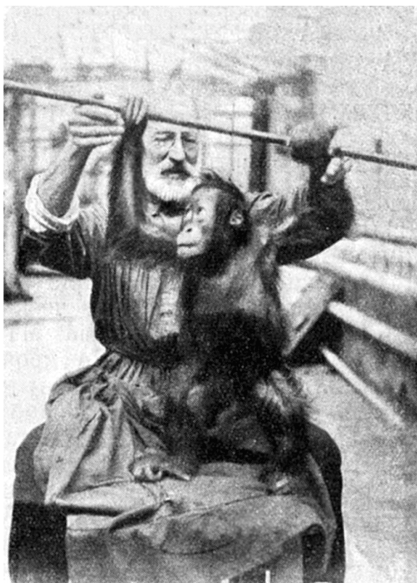
Рисунок 1. «Годовалый оранг-утан “Фриц”» [цит. по: Нестурх, 1928, с. 8]. Figure 1. “A one-year-old orangutan Fritz” [cit. Nesturkh, 1928, p.8].

С апреля 1928 года М.Ф. Нестурх начинает работу по изучению крови орангутана. У годовалой Фрины определена группа крови А(II) 2 , а также проведено изучение белой крови по Шиллингу. Михаил Федорович сравнивает гемограммы Фрины и чело-