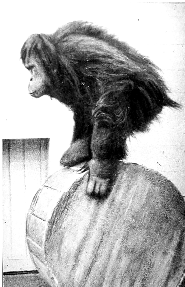
Рисунок 5. «Поела Фрина, теперь и поиграть можно» (цит. по: «Утро в Зоопарке», серия диапозитивов, 1940, слайд 13, Электронный ресурс, URL: https://vchaplina-arhiv.livejournal.com/15789.html , дата обращения – 20.04.2022)

Фрина очень любила купаться. Ещё когда она была совсем маленькой, в жаркой, влажной атмосфере обезьянника ей устраивали тёплые ванны, в которых она с удовольствием плескалась. После купания её насухо вытирали полотенцем или простыней, которые она пыталась стянуть, чтобы