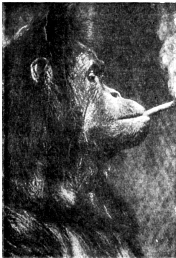
Рисунок 6. «Фрина – «курильщица»» [цит. по: Нестурх, 1949, с. 360] Figure 6. «Phryne is a smoker» [cit. Nesturkh, 1949, p. 360]

Разницу в темпераментах обезьян хорошо демонстрирует пример, описанный Нестурхом [Нестурх, 1949]. Как-то раз люди поставили